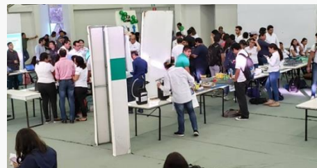
Instituto Tecnológico de Villahermosa

Proyectos en beneficio de sectores específicos con impacto ambiental, salud o emprendimiento.