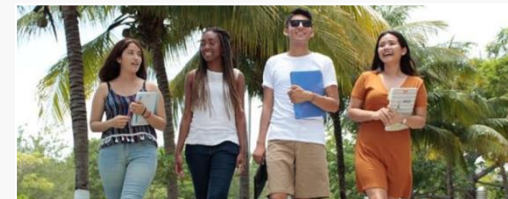
Estudiantes de la Universidad del Caribe